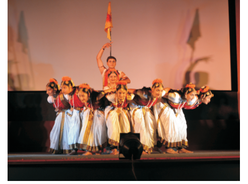
નૃત્યભારતી સંસ્થાની નૃત્યાંગનાઓ પ્રેક્ષકોને અભિભૂત કરતા